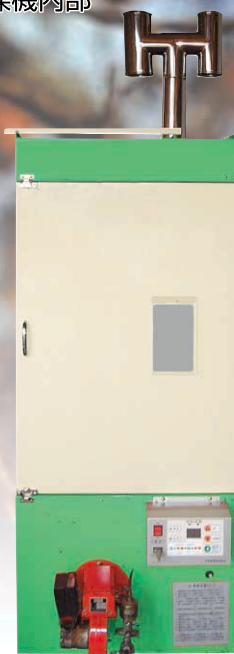
■乾燥機外観 (写真はTB-10-W)